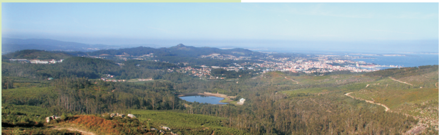
Vista cara ao encoro do Con (punto de partida da ruta). Ao fondo a ría, Vilagarcía de Arousa e o monte Lobeira