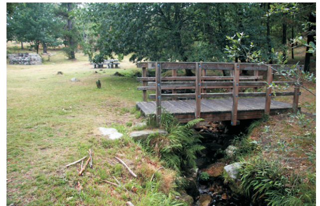
Área recreativa da Fontefría

Na estrada de Vilagarcía a Caldas cóllese o desvío a Castroagudín e ao centro hidrobiolóxico do río do Con. Ao chegar ao encoro atópanse os primeiros indicadores da ruta Castroagudín-Fontefría. Da Fontefría aos cumes do Xiabre pódese coller case calquera dos camiños que soben, o máis doado é a estrada pero pódese chegar tamén combinado carreiros, pistas e cortalumes.