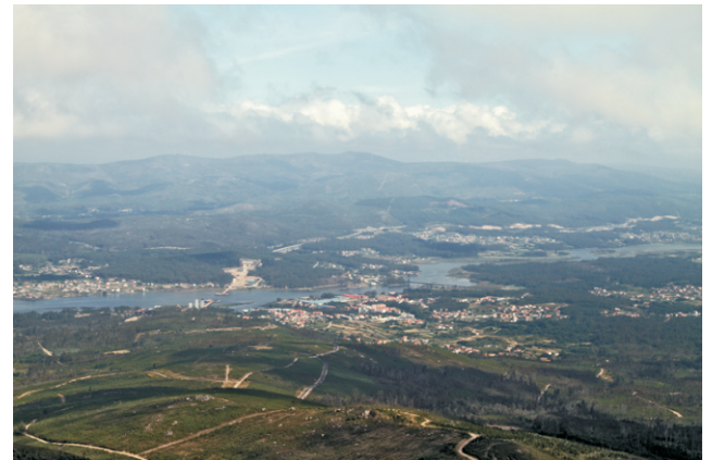
Vista dede o Xiabre cara o tramo final do Ulla (Catoira)

Unha ruta para gozar de magníficas vistas sobre a ría de Arousa, o val do Salnés e o tramo final do curso do río Ulla.