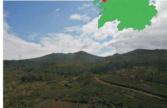
Cumes do Xiabre desde A Fontefría